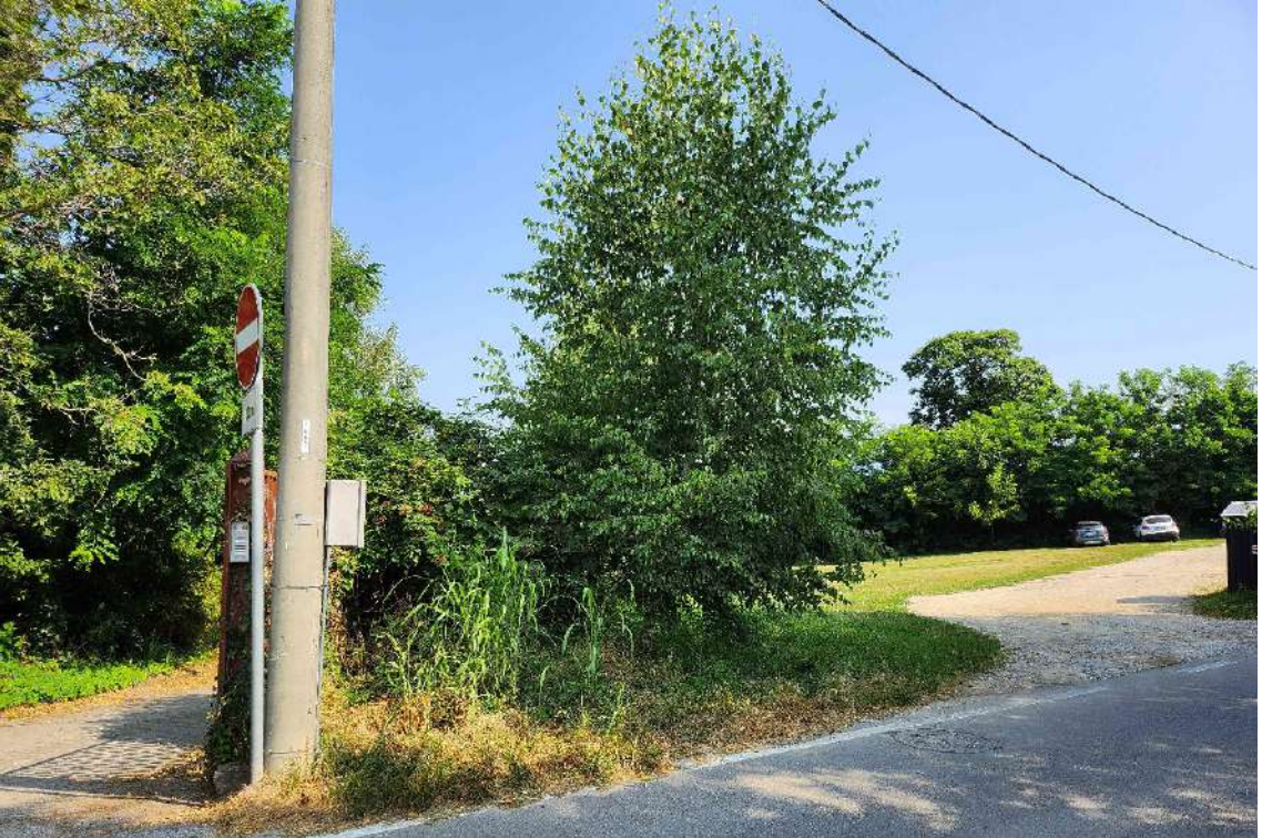
DOCUMENTAZIONE FOTOGRAFICA 5