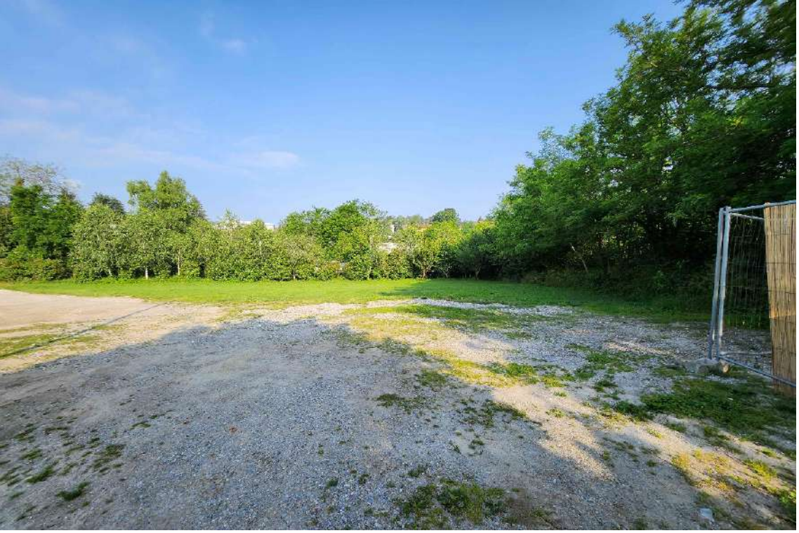
DOCUMENTAZIONE FOTOGRAFICA 2