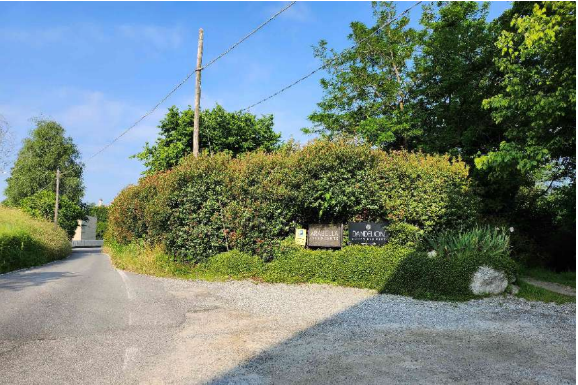
DOCUMENTAZIONE FOTOGRAFICA 1