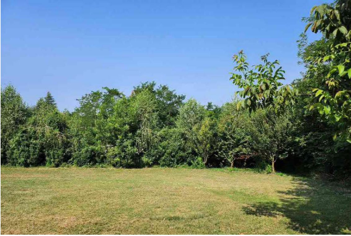
DOCUMENTAZIONE FOTOGRAFICA 7