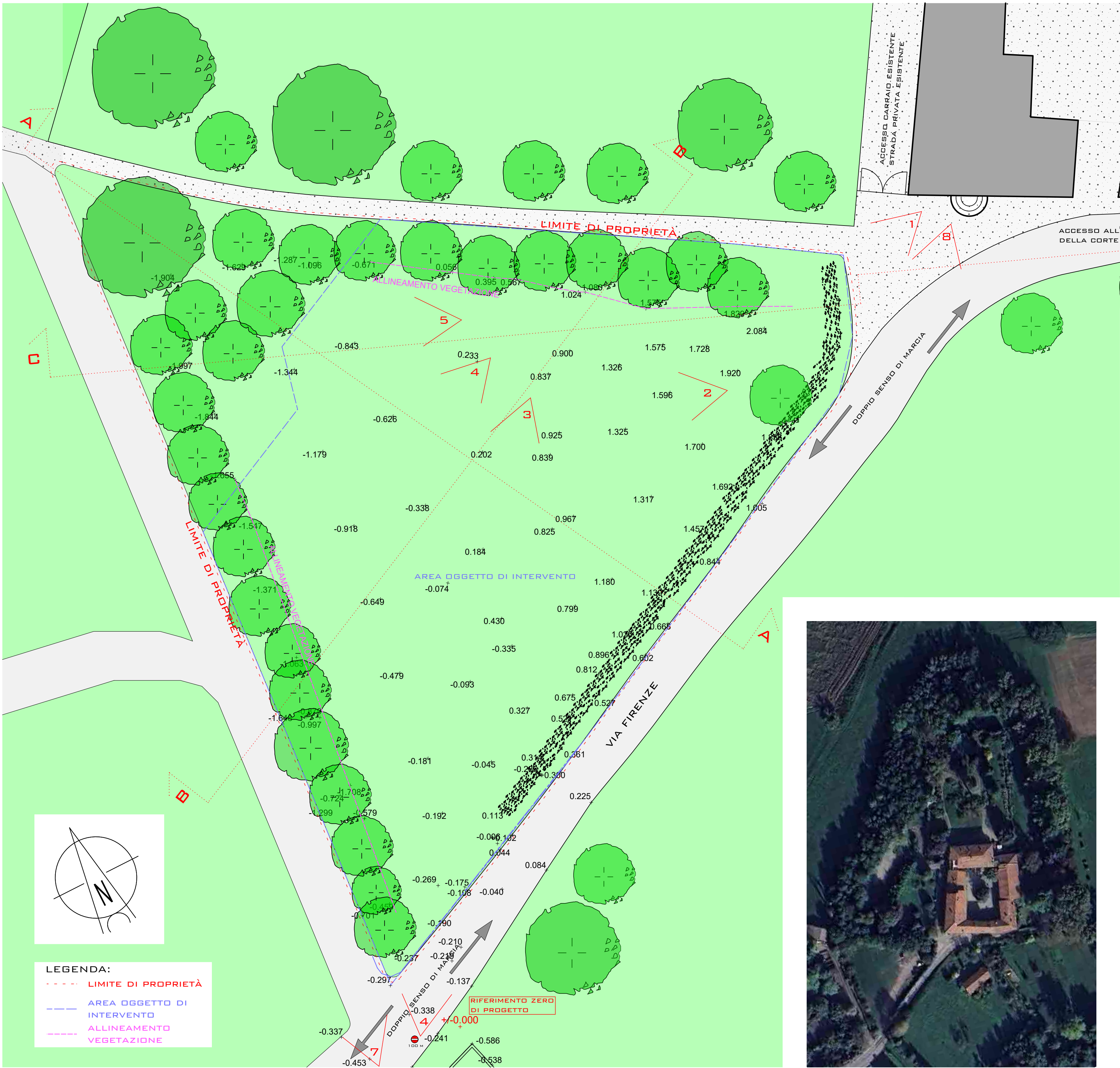
PLANIMETRIA STATO DI FATTO Scala 1:200