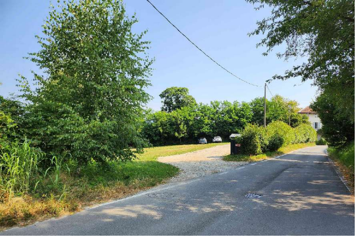
DOCUMENTAZIONE FOTOGRAFICA 3