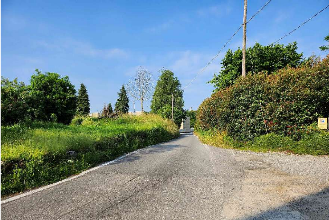
DOCUMENTAZIONE FOTOGRAFICA 8