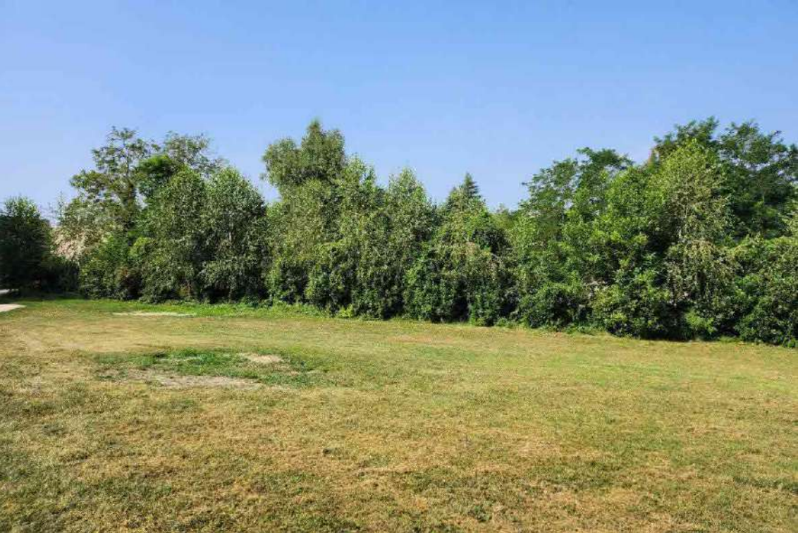
DOCUMENTAZIONE FOTOGRAFICA 4