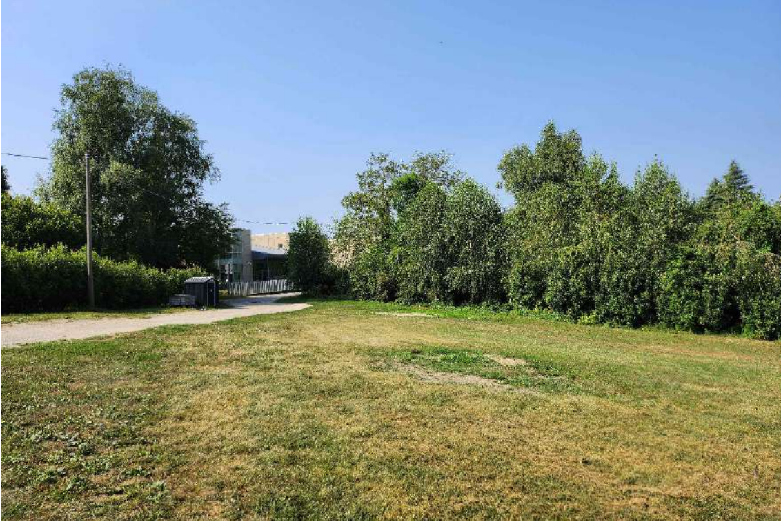
DOCUMENTAZIONE FOTOGRAFICA 6